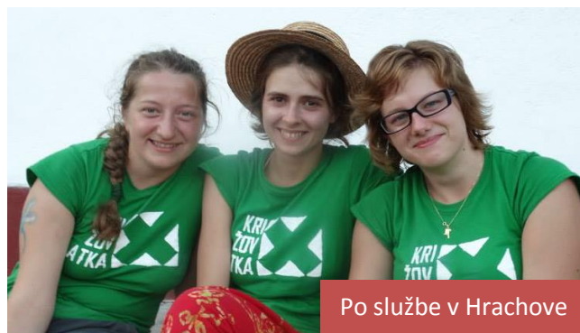
Po službe v Hrachove

Naša mládež pokračuje v služení. Po výjazde s dôrazom na šírenie poznania Božej vôle pre tento svet a žehnanie iným, sa niekoľko akcieschopných ľudí dobrovoľnícky zapojilo do príprav a realizácie SEMfestu – celoslovenského evanjelického festivalu mladých. Aj vďaka nim sme my ostatní ako účastníci mohli zažiť veľmi dobrý čas. SEMfest sú tri dni plné počúvania o evanjeliu a jeho veľmi praktickej aplikácii do našich životov. Prednášky, osobné príbehy ľudí, koncerty, tvorivé dielne, rozhovory so známymi aj neznámymi ľuďmi z celého Slovenska, to všetko je zamerané na to, aby sa naši mladí ľudia budovali a budovali a svoje spoločenstvá. Podobne mládežníci slúžili so SEMfestovým tímom aj na CampFeste.