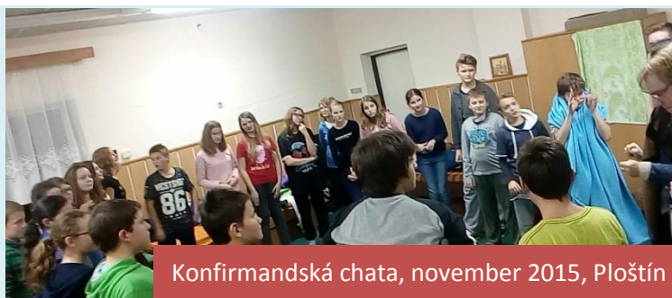
Konfirmandská chata, november 2015, Ploštín

Pán Boh koná v každej oblasti cirkevného zboru. Výnimkou nie je ani dorast, na ktorom tohto roku pribudlo veľa nových tvárí. Na konfirmačnú výučbu sa prihlásilo 30 mladých ľudí, no nie je zvykom, aby sa po pár týždňoch vzhodenia na výučbu rozhodli prísť v piatok na dorast. Teší nás, že takmer každý piatok tam pribudne nejaký ten konfirmand. Iste k tomu prispela aj konfirmačná chata (19.11. - 22.11. 2015), na ktorej sa bližšie spoznali a takisto aj nás, starších, mohli vidieť v inom svetle. Radosť máme aj z toho, že po dlhom čase sa opäť vybudoval konfirmačný tím, ktorý pripravuje chaty, dorast, ale najmä vedie našich mladých k Pánu Bohu. Zatiaľ sme len v akomsi "skúšobnom móde", no veríme, že takáto zostava nám vydrží čo najdlhšie. Neostáva nám teda nič iné, len vytrvať na modlitbách, aby sa nám konfirmandi "uchytili" a dokázali kráčať s Pánom Bohom.