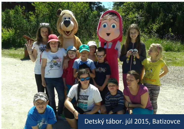
Detský tábor. júl 2015, Batizovce

Nový školský rok na besiedke otvorili Ježišove podobenstvá. V súčasnosti pripravujeme krátky program na Štedrý večer a tiež program na novoročné zborové popoludnie, ktoré sa uskutoční 3.1.2016 v Evanjelickom cirkevnom dome o 14:30 hod. Dieťa je Božím darom pre nás, preto dovoľme deťom prichádzať k Nemu.