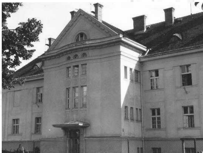
Budova nového sirotinca