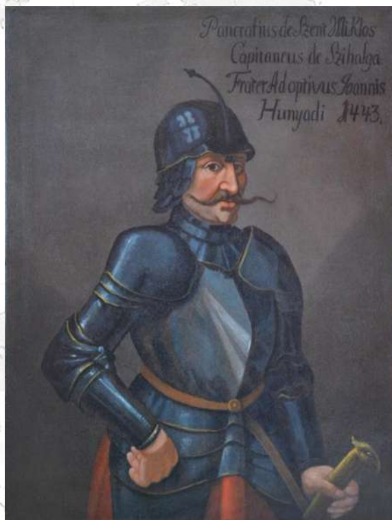
Kapitán Pongrác