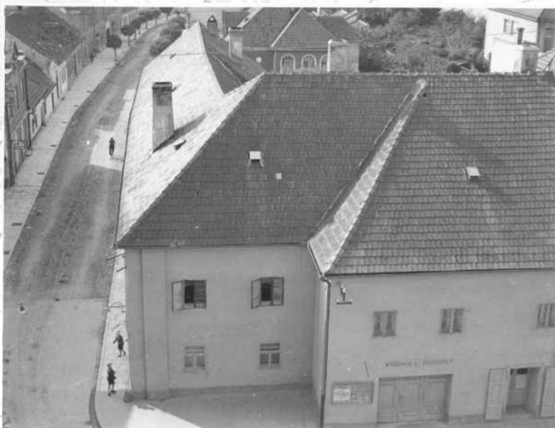
Pongrácovská kúria bol jeden zo súkromných domov, kde sa schádzali evanjelici (fotografia je z 50. rokov)