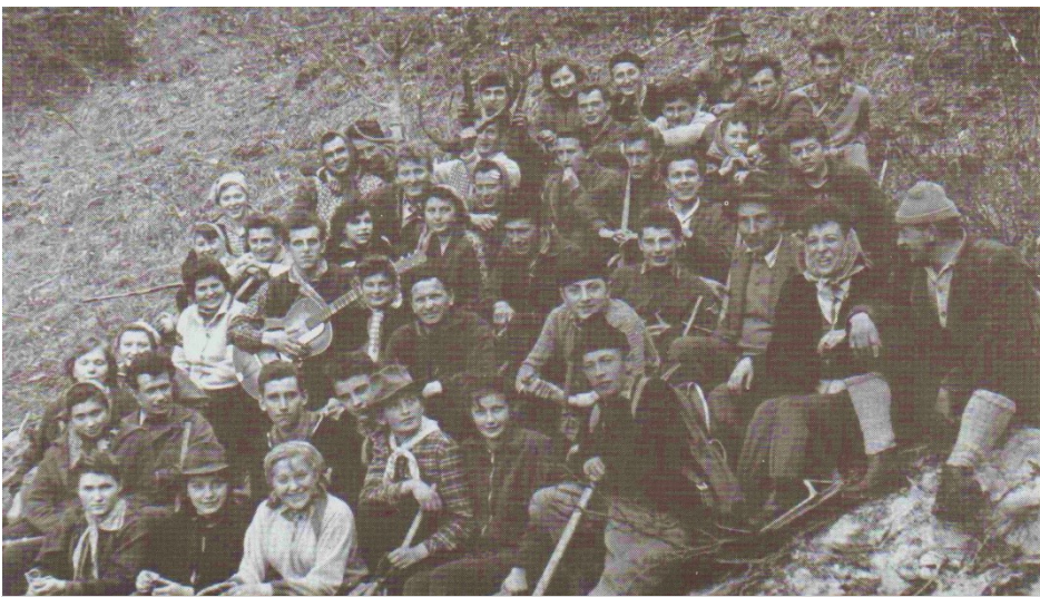
Brigáda evanjelickej mládeže pri sadení stromkov (1957)