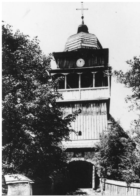
Artikulárny kostol v Paludzi