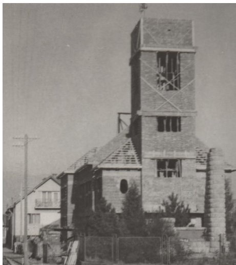
Plot sa staval kvôli okolochoodiacemu dobytku