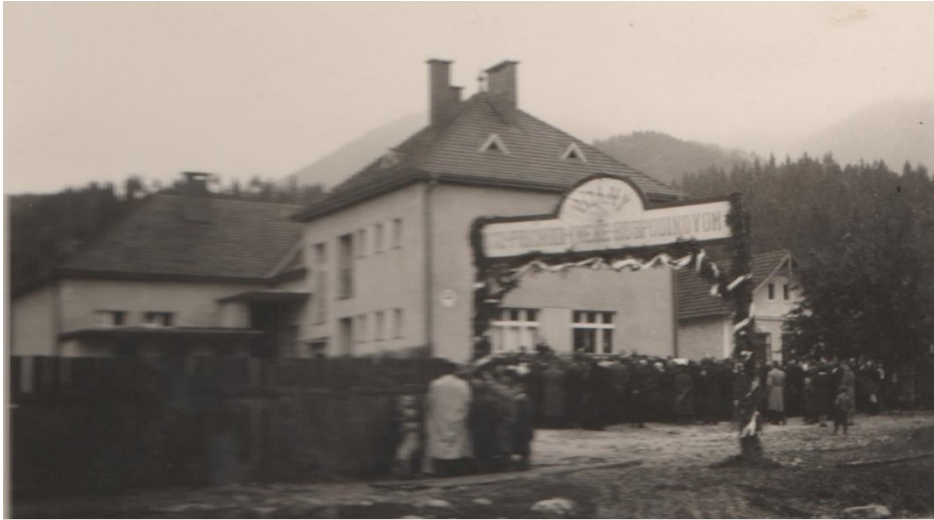
Otvorenie novej školy