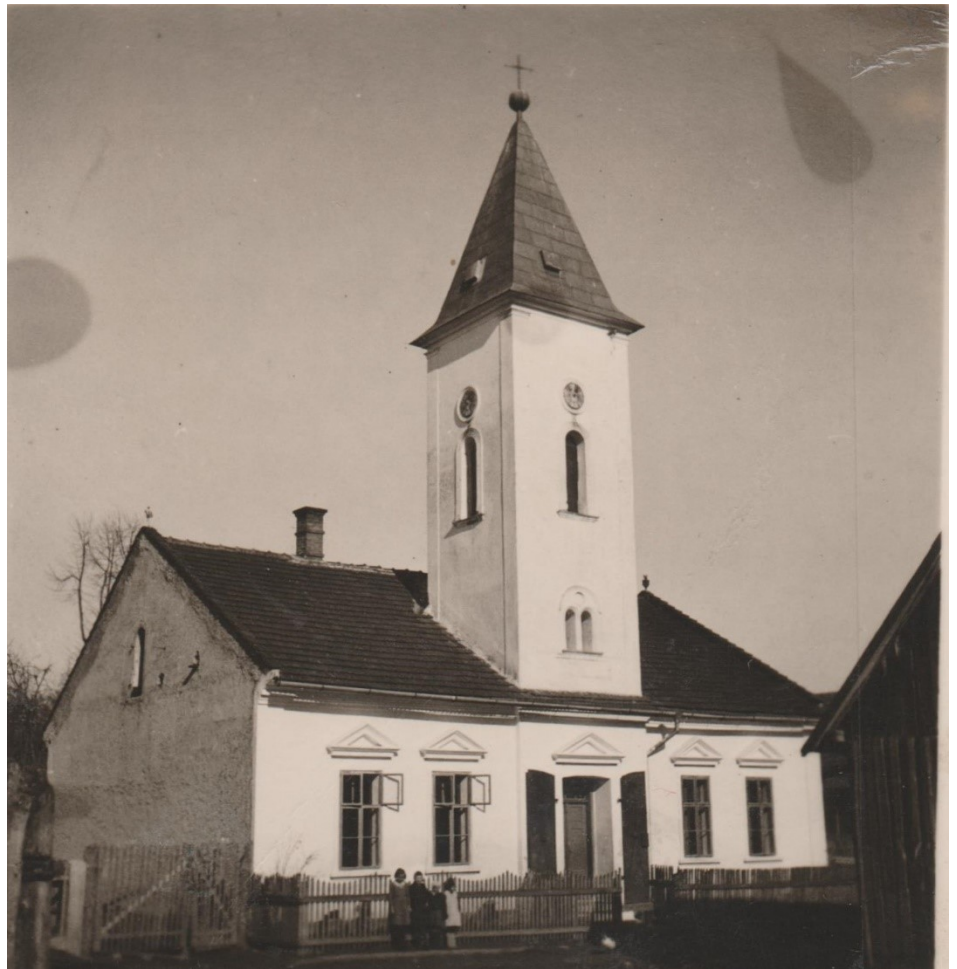
Stará škola s modlitebňou

vo vašich srdciach...“ Evanjelickí učitelia vykonávali po udelení vokátora aj popoludňajšie služby Božie – večierne.